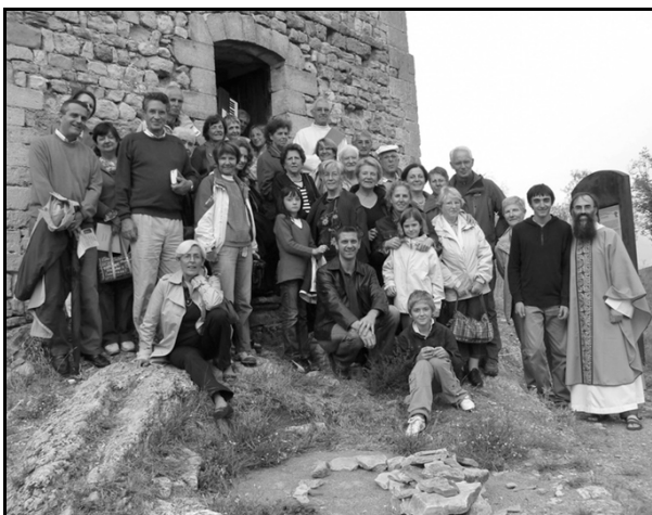
Messe à la Chapelle Sainte Agathe, le samedi 19 septembre : Un peuple s'unit pour annoncer l'Évangile.

Elles sont composées de plusieurs paroisses, appelées par l'évêque à former ensemble une « communauté missionnaire » efficace, dans un territoire donné du diocèse, conformément au programme pastoral diocésain (Source : Zénit).