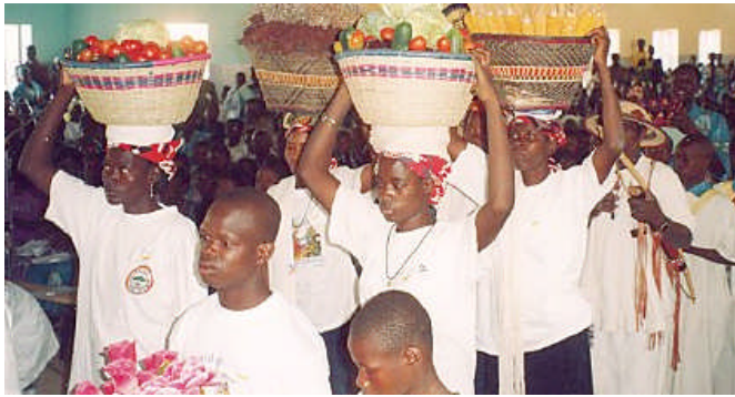
La procession des offrandes est plus développée dans certains pays de mission que par chez nous.