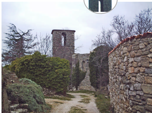
Maintenant que le clocher a récupéré sa toiture, il attend une nouvelle cloche.

Justement, vous cherchez une cloche, savez-vous que lors de l'inauguration d'une cloche d'église, l'usage veut qu'une cérémonie religieuse lui soit consacrée durant laquelle un nom lui est attribué et on lui affecte un parrain et une marraine.