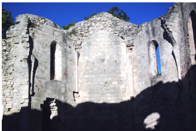
Une église à ciel ouvert : Rien pour bloquer les prières qui montent vers le ciel ! Rien pour bloquer les grâces qui en descendent !