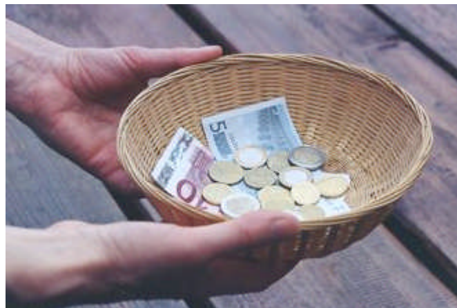
L'Église vit de vos dons